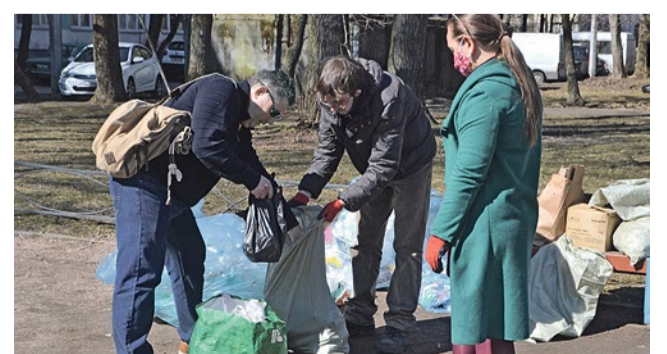
Точка сбора вторсырья по цветам