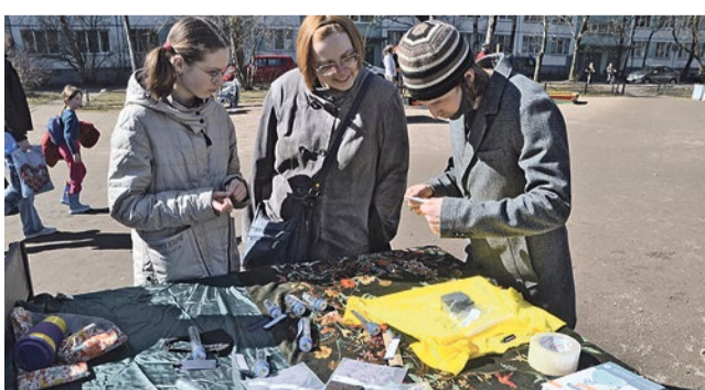
В музее «Переработка. Мифы и реальность»

Карта с пунктами приема вторсырья: recyclemap.ru/spb .