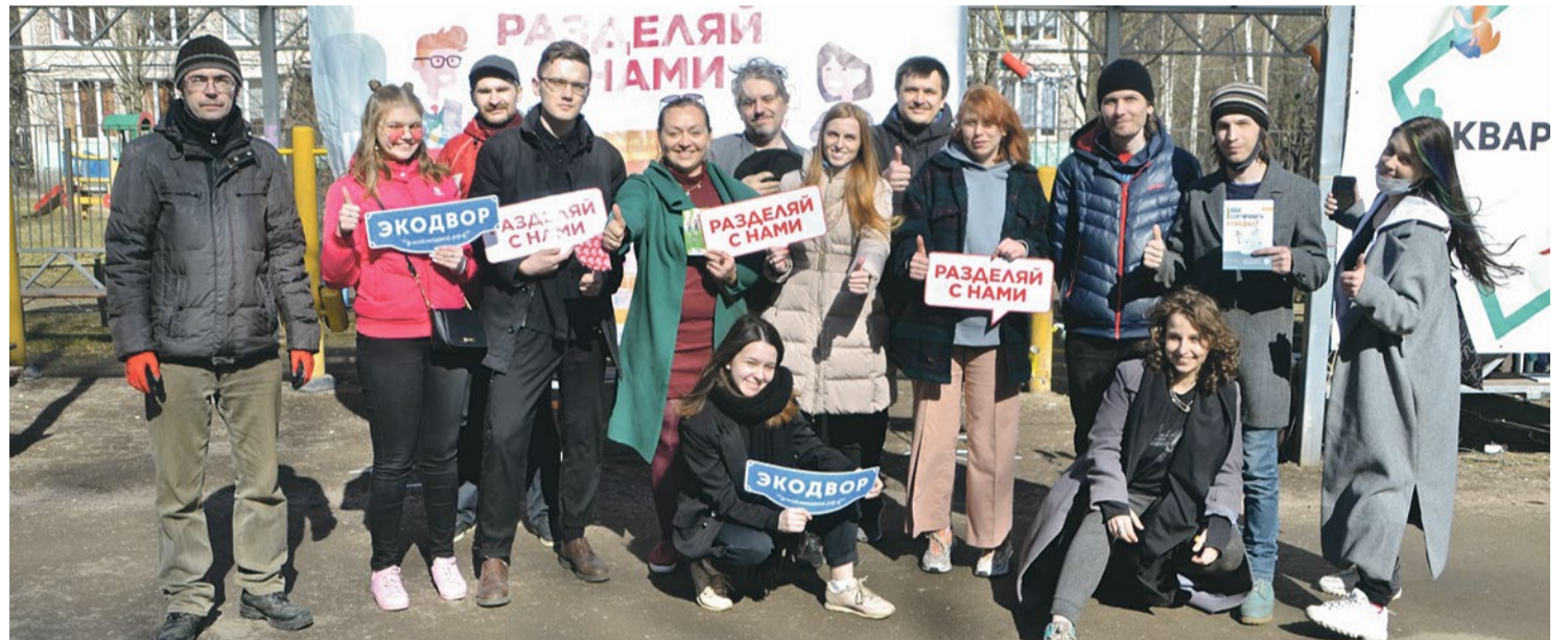
Команда волонтеров проекта «Экодвор», депутатов, Молодежного совета и сотрудников муниципалитета № 72 на празднике «Экодвор»

На Софийской улице, 44 каждую первую субботу месяца проходят акции «Раздельного Сбора» по приему вторсырья. Волонтеры движения принимают твердый пластик с маркировкой 5, мягкий пластик с маркировками 2, 4 и 5, упаковочный пенопласт от техники, упаковку