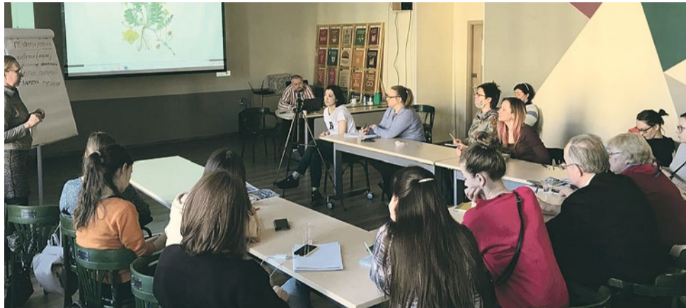
Жители муниципального образования № 72 и студенты – участники курса «Создай свой сад» слушают лекцию о травянистых многолетниках, организованную школой городского озеленения «Озелени»

При создании проектов жители опираются на знания, полученные на лекциях Людмилы Белых. Так, на одной из них жителям рассказывали, как создавать блочные композиции со злаками. Они требуют меньшего ухода в сравнении с сезонными цветниками со сменным