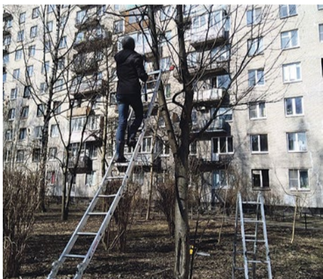
Обрезка деревьев в сквере на улице Бельи Куна, 5

В пяти скверах округа на Бухарестской, 94/3–94/4, 86/1–86/2; Бельи Куна, 7; Пражской, 37/2–37/3; Софийской, 20/3–20/4 и 10 адресам по заявкам местных жителей провели санитарную обрезку деревьев. Специалисты убрали сухие и поврежденные ветки, придали растениям красивую форму.