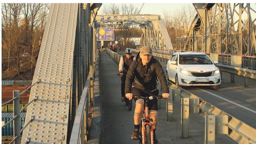
Цимбалинский путепровод.

По задумке авторов письма, Цимбалинский путепровод может стать частью велодорожки, которая могла бы, взяв свое начало на набережной Невы – в саду Крупской или в парке имени Ба-