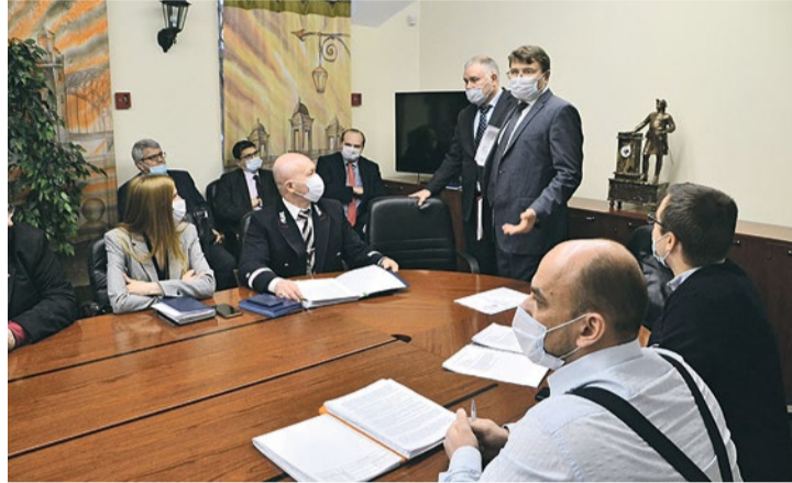
Депутаты и жители муниципального округа № 72 на встрече с представителями КРТИ и «Ленгипроинжпроект»

Поскольку новый путепровод будет выше Цимбалинского моста, насыпь, ведущая к Фарфоровскому посту, будет снесена. С Фарфоровского поста машинам