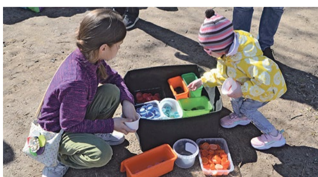
Малыши сортируют пластиковые крышечки по цветам